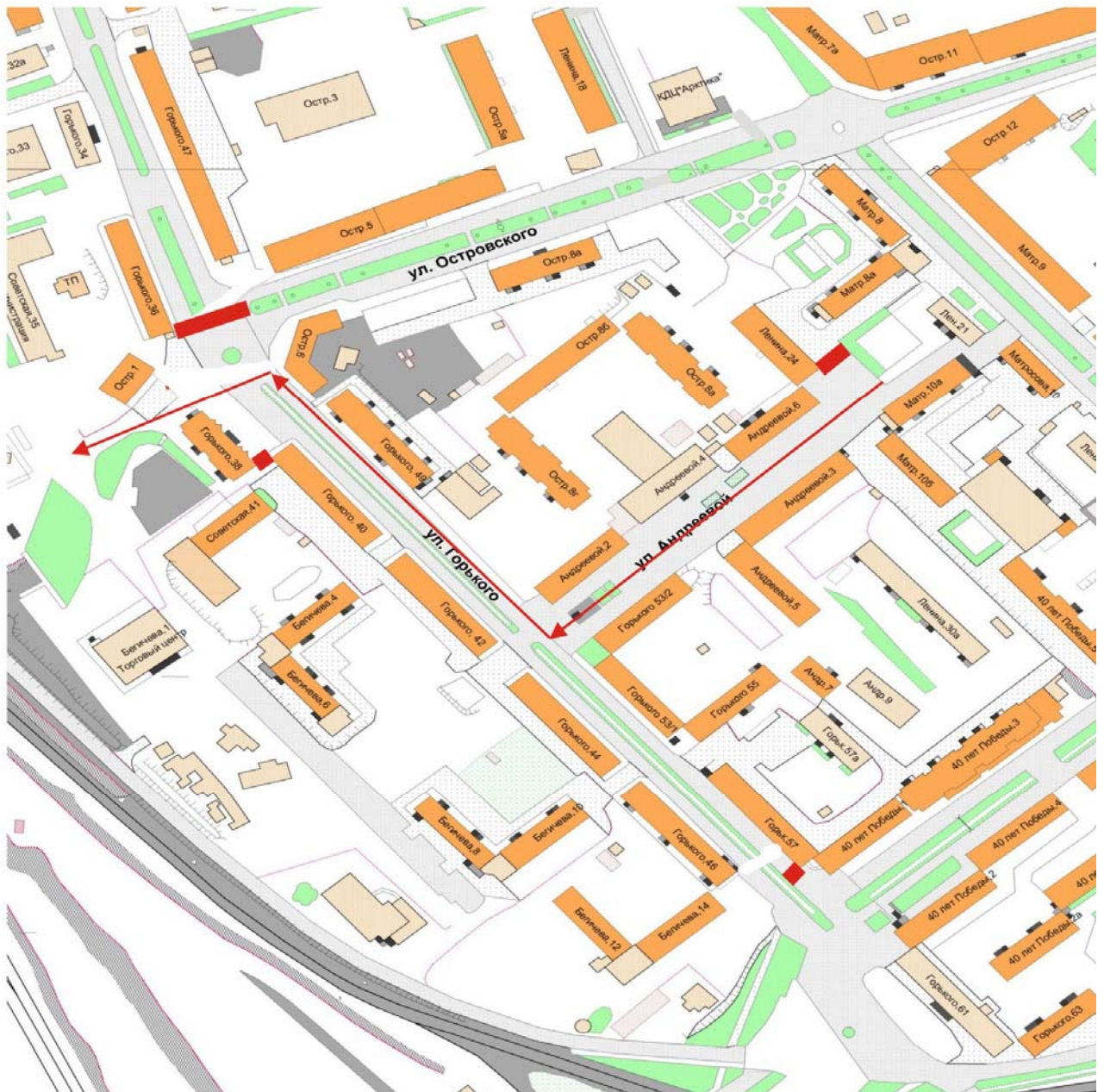
Схема перекрытия дорожного движения 11.08.2018 с 13:30 до 14:00

Приложение к распоряжению Администрации города Дудинки от 01.08.2018 № 704